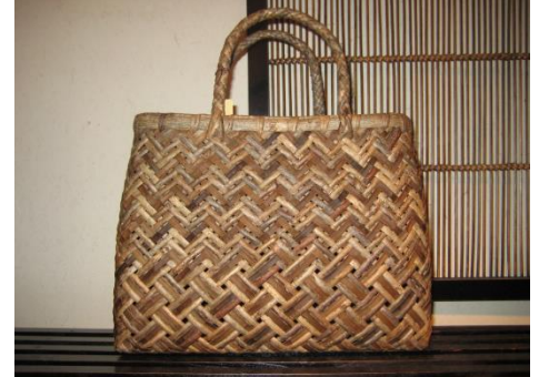
3本四ツ目替わり縦網代 ★★★